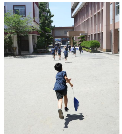
体育館へダッシュ!!