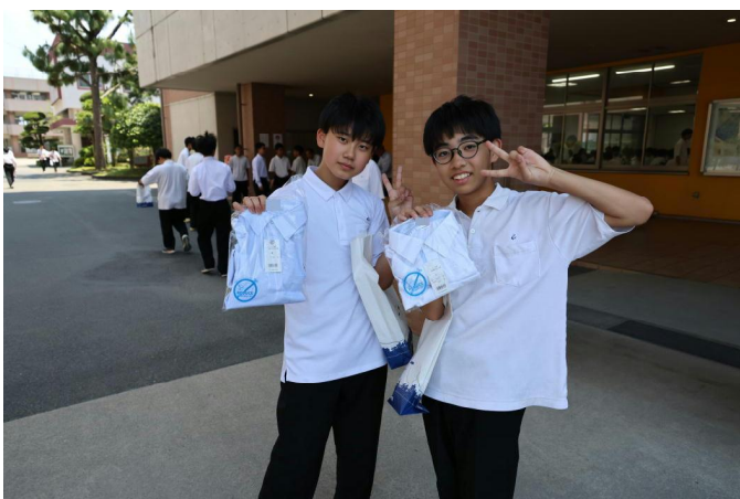
手渡された新しい夏服。左が水色、右が白です