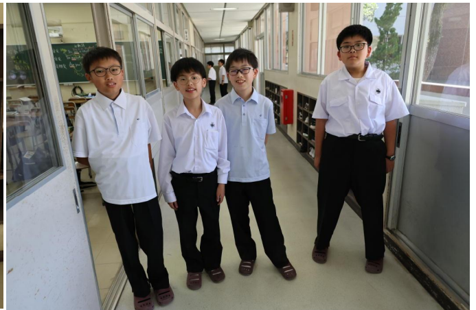
左から新ポロ(白)・長袖シャツ・新ポロ(水色)・半袖開襟シャツ