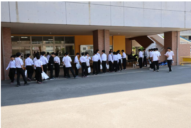
5月15日、引き渡しを待つ行列

その引き渡しは5月15日に行われ、中1やこの春高校に新たに入学した高1 EFを中心として多くの生徒が新しいデザインのポロシャツを手に入れました。その後すぐ着替えた生徒がいたので、聞いてみると「従来品より格段に涼しく、過ごしやすい」とのことでした。ここ数日急に暑くなり、結果としてタイムリーな夏服引き渡しになりました。