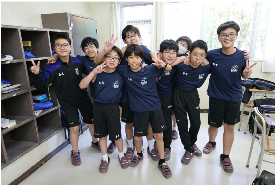
新しい体操服で記念撮影(中1)