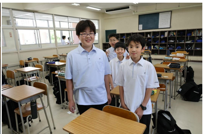
5月18日、中1の教室にて。左2人が水色、右2人が白です