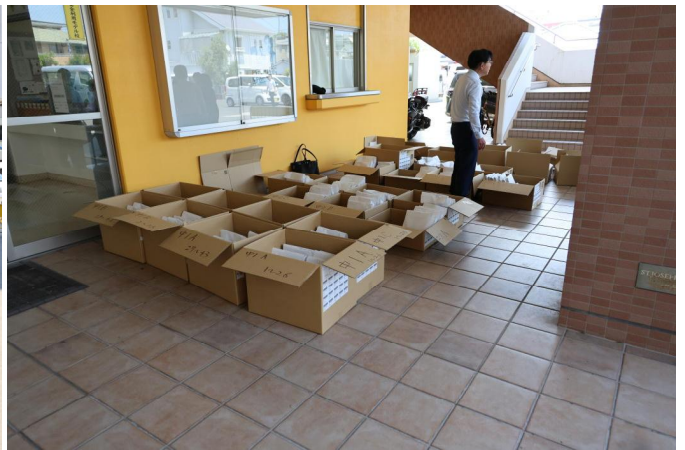
新しい夏服はクラス毎に仕分けられていました