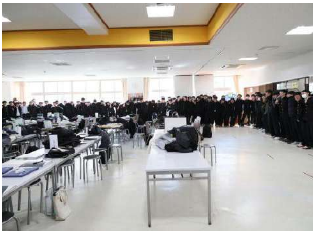
みんなで肩を組みラ・サール讃歌を合唱