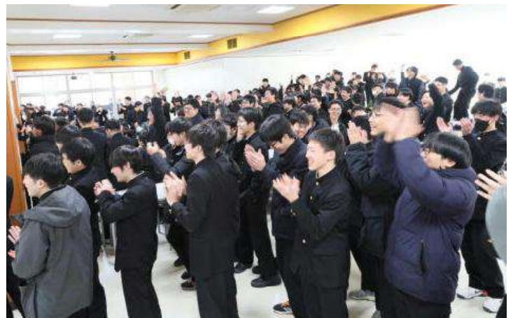
先生のギャグに大きな拍手が送られました