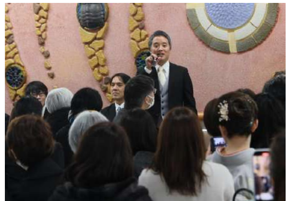
お別れ会 学年主任挨拶