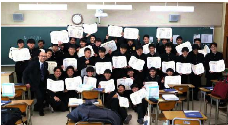
終礼後に集合写真 (A組)